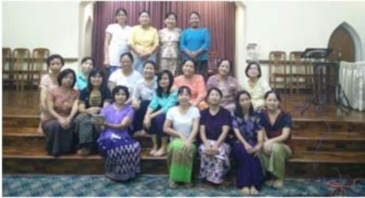
အချိန်။ ။ ဧပြီနှင့်မေလ၊ ၂၀၁၆ခုနှစ်။ နေရာ။ ။ ရန်ကုန်ဗဟိုအသင်းတော်၊ ရန်ကုန်တိုင်း။ တက်ရောက်သူ။ ။ အမျိုးသမီး (၁၈)ဦး။