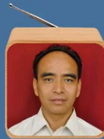
သိက္ခာတော်ရဦးဆွင်းဆောင်ဆန် ချင်းဘာသာ