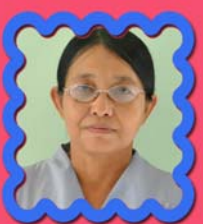
ဆရာမဒေါ်ရင်ရင် ဌာနဆိုင်ရာညွှန်ကြားရေးမှူး