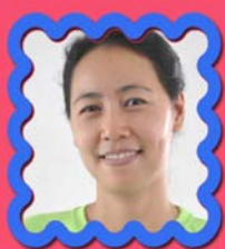
ဆရာမဒေါ်လွန်းစက် ကမ္ဘာလုံးဆိုင်ရာရုံးစာရေးမ