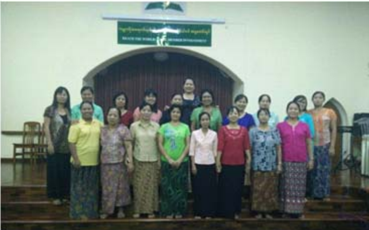
အချိန်။ ။ ဧပြီနှင့်မေလ၊ ၂၀၁၆ခုနှစ်။ နေရာ။ ။ ရန်ကုန်ဗဟိုအသင်းတော်၊ ရန်ကုန်တိုင်း။ တက်ရောက်သူ။ ။ အမျိုးသမီး (၁၈)ဦး။