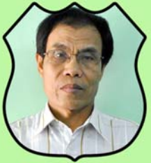
သိက္ခာတော်ရဦးလှကွန်း အတွင်းရေးမှူး