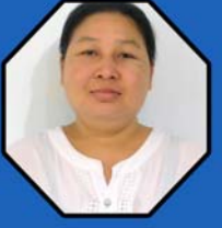
ဆရာမကြူကြူအေး ရုံးစာရေးမ