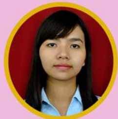
ကျင်ဟောက်ညောင် ရုံးစာရေး