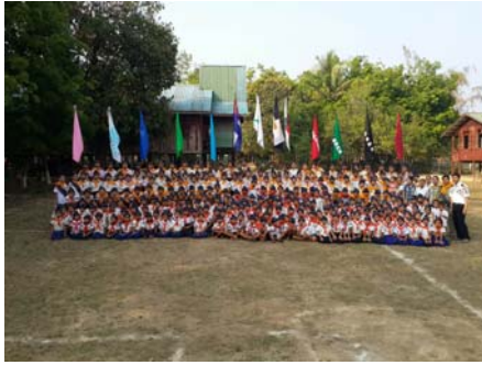
အရှေ့တောင်တိုင်း၊ လေးဖိုးထား။