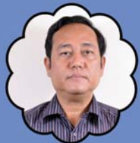
သိက္ခာတော်ရဦးစင်မောင်လတ် ဓမ္မရေးရာဌာန နှင့် နှိပ်စားရေးမှူး