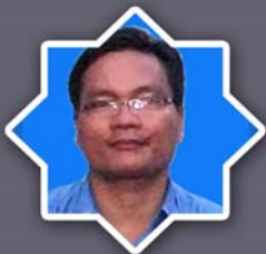
သိက္ခာတော်ရဦးဟောက်ဂိုထန် UMAS