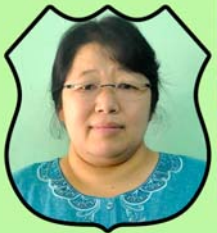
ဆရာမဒေါ်ဂျွန်နီနော ဌာနဆိုင်ရာညွှန်ကြားရေးမှူး