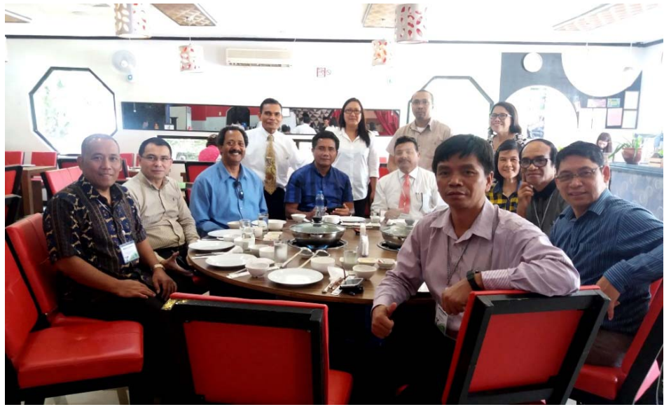
၂၀၁၆ခုနှစ်၊ မေလ SSD ဥပုသ်စာဖြေဌာနမှူးကြီးမှူးကျင်းပသော Advisory တွင် GC, SSD နှင့် Union မှ ညွှန်ကြားရေးမှူးများ