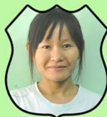
ဆရာမရိုးဘာ ကမ္ဘာလုံးဆိုင်ရာရုံးစာရေးမ