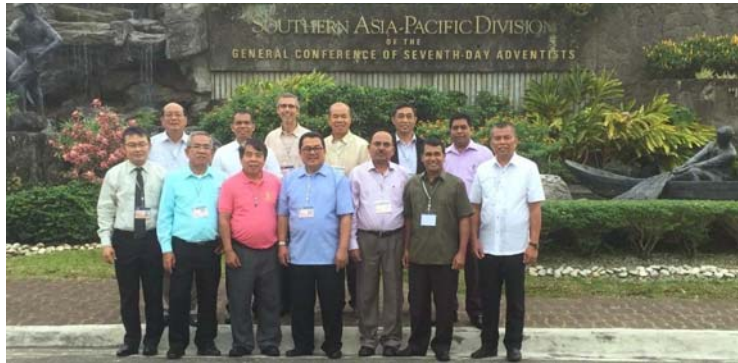
၂၀၁၆ခုနှစ်၊ မေလ SSD ဘဏ္ဍာစိုးဌာနမှကြီးမှူးကျင်းပသော Adviosry တွင် GC, SSD နှင့် Union မှ ညွှန်ကြားရေးမှူးများ