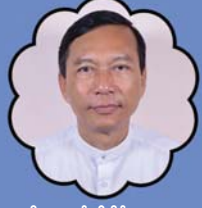
သိက္ခာတော်ရဦးရှင်းသာဌေး ဆက်သွယ်ရေးဌာန နှင့် နှိပ်စားရေးမှူး