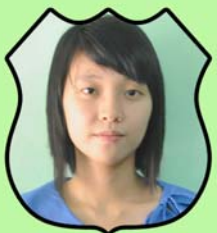
ဆရာမအယ်ကမ္ဘီဆဲ ငွေကိုင်