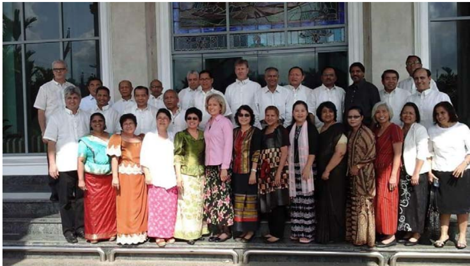
၂၀၁၆ခုနှစ်၊မေလ ၁၁-၁၄အထိ၊ SSD ဓမ္မရေးရာဌာနမှကြီးမှူးကျင်းပသော Adviosry တွင် GC, SSD နှင့် Union မှ ညွှန်ကြားရေးမှူးများ