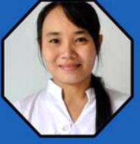
ဆရာမအေးအေးလှ ကမ္ဘာလုံးဆိုင်ရာရုံးစာရေးမ