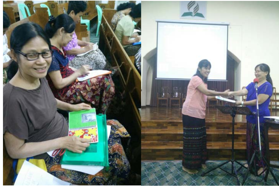
အမျိုးသမီးခေါင်းဆောင်မှုသင်တန်းကိုတက်ရောက်သူများပုံ။ သင်တန်းဆင်းလက်မှတ်ပေးအပ်နေပုံ။