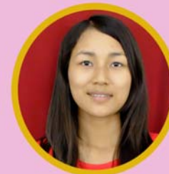
မန်ရှင်းနွမ် ငွေကိုင်