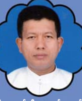
သိက္ခာတော်ရဦးလားစောဘော်လယ် ပုံနှိပ်ထုတ်ဝေရေးဌာန နှင့် နှိပ်စားရေးမှူး