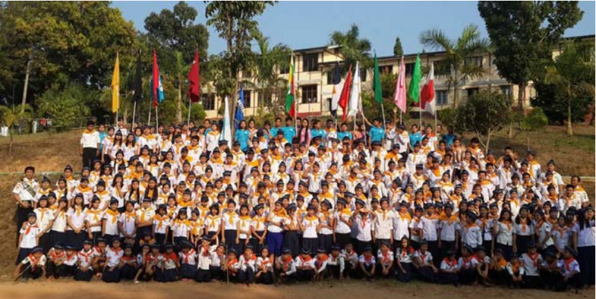
၂၀၁၆ခုနှစ်၊ CMAS Pathfinder သင်တန်းဆင်းပွဲ

မြန်မာယူနိုက်တက်ဌာနမှ Pr. Wilson Poဦးဆောင်ကျင်းပသော Adventure Pathfinder Investiture Program ( YAS) သင်တန်းဆင်းပွဲကို ၂၀၁၆ခုနှစ်၊ ဖေဖော်ဝါရီလ၁၁ရက်နေ့တွင် အမှတ်(၆၈)၊ ဦးဝိစာရလမ်းမရှိ ခရစ်တော်ကိုမြော်လင့် သောသတ္တမနေ့အသင်းတော် (ရန်ကုန်ဗဟိုအသင်းတော်)တွင် စည်ကားသိုက်မြိုက်စွာ ကျင်းပပြုလုပ်ကြောင်း သတင်းရရှိပါသည်။