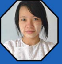
ဆရာမအိသီးရယန် ဆေးသာသနာပြု