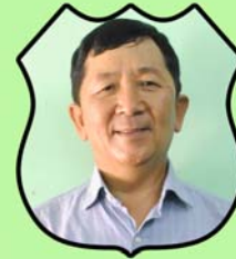
သိက္ခာတော်ရဦးဟောရှာယ ဌာနဆိုင်ရာညွှန်ကြားရေးမှူး