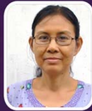
ဆရာမကြီးဒေါ်အိအိ ပညာရေးဌာနမှူး