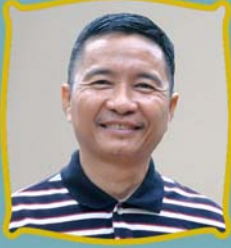
သိက္ခာတော်ရဦးစေးလွင် ဘာသာပြန်ဌာန