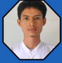
ဆရာမဇေယျာလင်း လက်ထောက်သင်းအုပ်