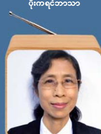
ဆရာမဒေါ်လှလှဖြင့် မြန်မာဘာသာ(လူငယ်)