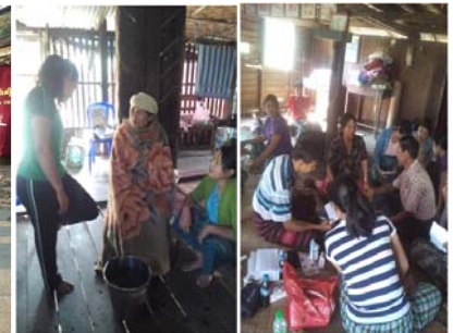
၂၀၁၆ခုနှစ်၊ မေလ ၊ SSD လူငယ်ဌာနမှ ကြီးမှူးကျင်းပသော Adviosry တွင် GC, SSD နှင့် Union မှ ညွှန်ကြားရေးမှူးများ