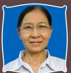
ဆရာမနန္ဒာတင်လှိုင် အင်စီနီကျာပြုကြောင်းတာဝန်ခံ