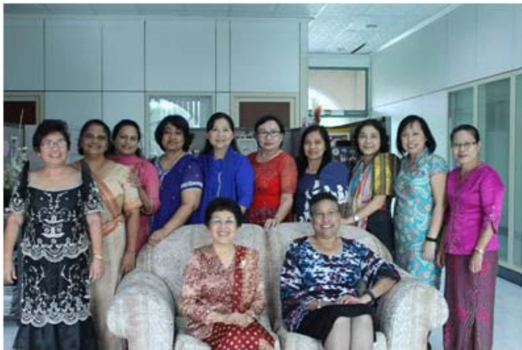
၂၀၁၆ခုနှစ်၊ မေလ ၁၆-၁၈အထိ၊ SSD Women's Ministries ဌာနမှ ကြီးမှူးကျင်းပသော Adviosry တွင် GC, SSD နှင့် Union မှ ညွှန်ကြားရေးမှူးများ