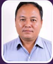
သိက္ခာတော်ရဒေါက်တာကောနေလီလှ ကျောင်းအုပ်ကြီး