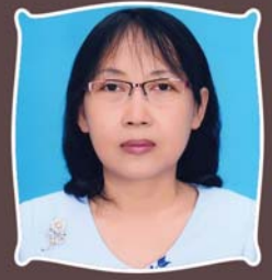
ဆရာမစိုးစန္ဒာ ဓမ္မစာပေးစာယူဌာန