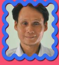
သိက္ခာတော်ရဦးမောင်ထို နယ်စီးဓမ္မဆရာ