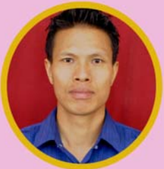
ဆရာဦးကပ်ခန့်တွင် စာရင်းကိုင်