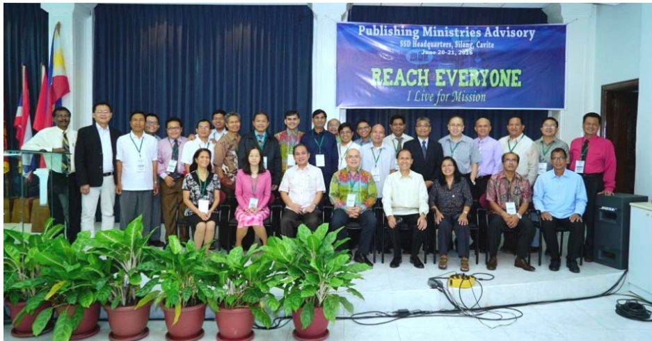
၂၀၁၆ခုနှစ်၊ ဇွန် ၂၀-၂၁ အထိ၊ SSD ဓမ္မစာပေဌာနမှကြီးမှူးကျင်းပသော Adviosry တွင် GC, SSD နှင့် Union မှ ညွှန်ကြားရေးမှူးများ