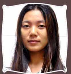
ဆရာမအက်စတာဟိန်း ရုံးစာရေး