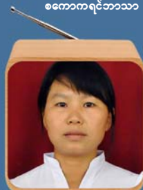
ဆရာမဒေါ်ယော်ဆွေ ကချင်ဘာသာ(လူငယ်)