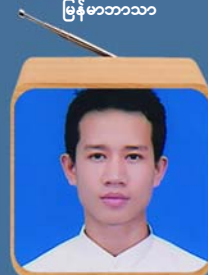
ဆရာရန်ပိုင်မျိုး ပိုးကရင်ဘာသာ