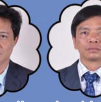
သိက္ခာတော်ရဦးဝေလစင်မိုး လူငယ်ဌာန နှင့် နှိပ်စားရေးမှူး