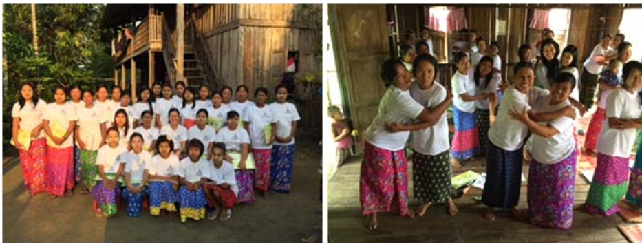
အချိန်။ ။ မေလ ၅-၇ရက်၊ ၂၀၁၆ခုနှစ်။ နေရာ။ ။ ညောင်ပင်လှ၊ ကျောက်တော်မြို့နယ်၊ ရခိုင်ပြည်နယ်(ရန်ကုန်တိုင်းသာသနာ)။ တက်ရောက်သူ။ ။ အမျိုးသမီး (၂၄)ဦး။