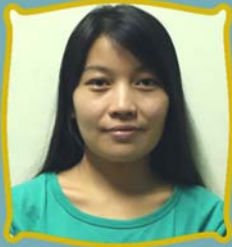
ဆရာမဗူးလီယာမင်း ငွေထိန်း/ငွေထုတ်