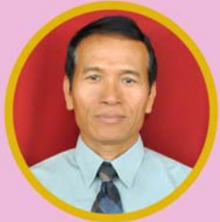
သိက္ခာတော်ရဦးရီဇေးမာ အတွင်းရေးမှူး