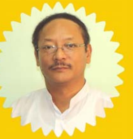
သိက္ခာတော်ရဦးနန်းဒိုးခါလ်း တက္ကသိုလ်ရေးမှူး