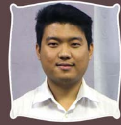
ဆရာထန်ကပ်ကမ်း မြော်လင့်ခြင်းအသံသွင်းဌာန