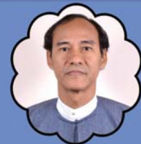
သိက္ခာတော်ရဦးခလေးဒီးယပ်စံဘရောင်း ပညာရေးဌာန နှင့် နှိပ်စားရေးမှူး