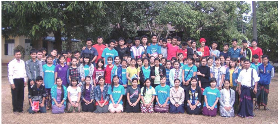
ကျောင်းသူကျောင်းသားများ ဓမ္မစာပေဖြန့်ချိရေးသင်တန်း၊ အရှေ့တောင်တိုင်း၊ SEAS (ဇန်နဝါရီ ၁၇၊ ၂၀၁၆)