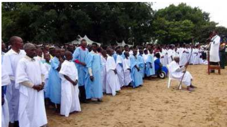
ဇွန်လ ၂ရက်၊ ၂၀၁၆ခုနှစ်သတင်း (Rwanda) ။

မြော်လင့်ခြင်းအသင်းတော်ကမ္ဘာ့ဌာနချုပ်၏ ဥက္ကဋ္ဌဖြစ်သူ တက်ဝေလ်စင် (Pr. Ted Wilson)က “ရဝန်ဒါရှိ အသင်းသူ/သားများသည် ကမ္ဘာတဝှမ်းရှိ အခြားဒေသမှ မြော်လင့်ခြင်းအသင်းတော်များအတွက် ပုံစံနမူနာအဖြစ်ရပ်တည်ခဲ့ကြသည်” ဟုပြောကြားခဲ့သည်။