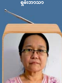
ဆရာမဒေါ်မမကြီး FM Radio