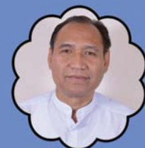
သိက္ခာတော်ရဦးတိမောသေဗုဒ္ဓားပေါယ် သာသနာပိုင်ချုပ်