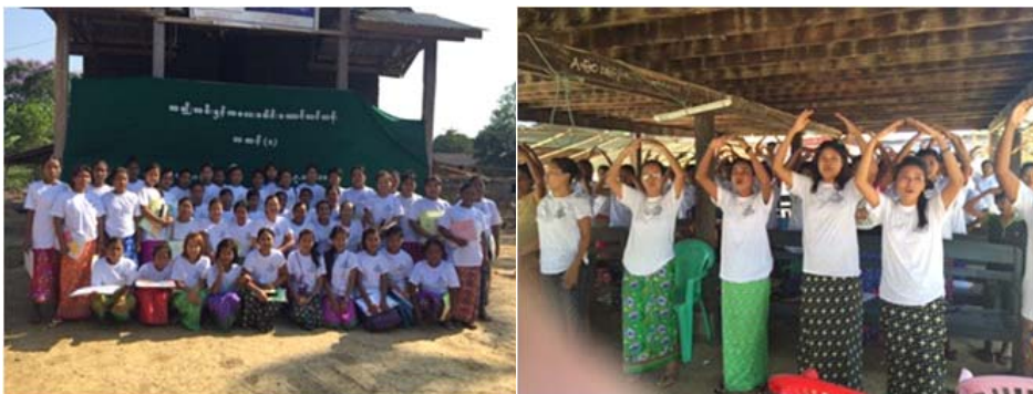
အချိန်။ ။ မေလ ၉-၁၁ရက်၊ ၂၀၁၆ခုနှစ်။ နေရာ။ ။ မဲလမောင်၊ အမ်းမြို့နယ်၊ ရခိုင်ပြည်နယ်(ရန်ကုန်တိုင်းသာသနာ)။ တက်ရောက်သူ။ ။ အမျိုးသမီး (၄၅)ဦး။