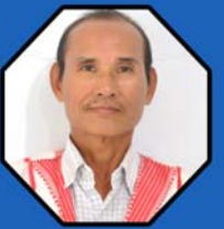
သိက္ခာတော်ရဦးစက္ကံရွှေ ဥက္ကဋ္ဌ