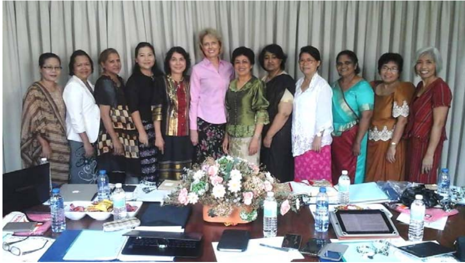
၂၀၁၆ခုနှစ်၊ မေလ ၁၁-၁၄အထိ၊ SSD Ministerial and SI ဌာနမှ ကြီးမှူးကျင်းပသော Adviosry တွင် GC, SSD နှင့် Union မှ ညွှန်ကြားရေးမှူးများ