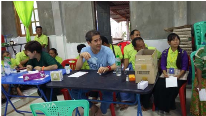
ဆေးကုသနေပုံ