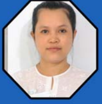
ဆရာမသန့်ရည်မွန် ရုံးစာရေးမ