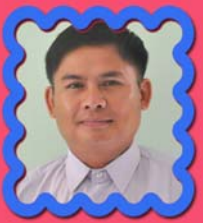
သိက္ခာတော်ရဦးဖိုးရု ဌာနဆိုင်ရာညွှန်ကြားရေးမှူး