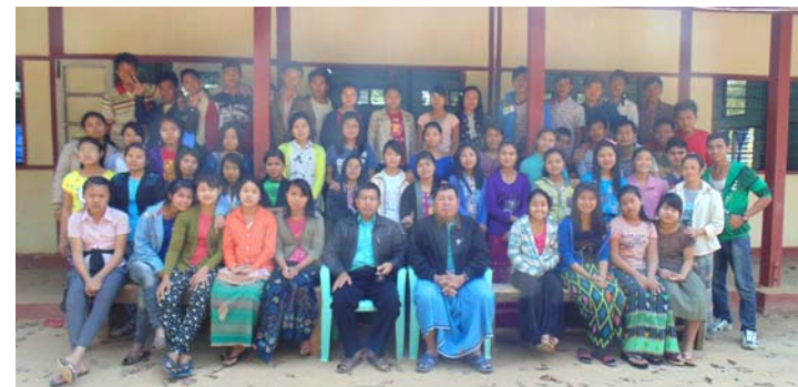
ကျောင်းသူကျောင်းသားများ ဓမ္မစာပေဖြန့်ချိရေးသင်တန်း၊ အလယ်ပိုင်းတိုင်း၊ CMAS (ဇန်နဝါရီ ၁၀-၁၁၊ ၂၀၁၆)