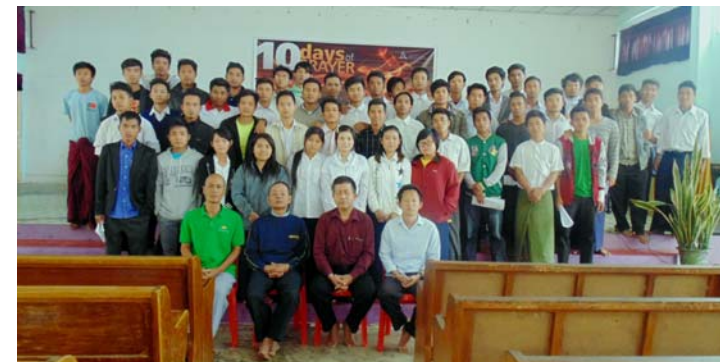
ကျောင်းသူကျောင်းသားများ ဓမ္မစာပေဖြန့်ချိရေးသင်တန်း၊ ဧရာဝတီတိုင်း၊ MUAS (ဇန်နဝါရီ ၁၃၊ ၂၀၁၆)