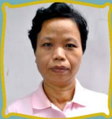
ဒေါ်ကြာမေ သင်္ချာရေးဌာန