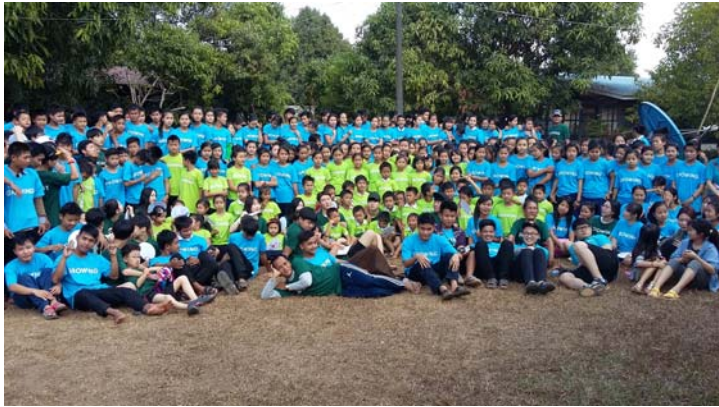
ကိုးရီးယားမှလူငယ်များနှင့်ရေပူခမ္မကျမ်းစာကျောင်းမှ လူငယ်များအမှတ်တရပုံ