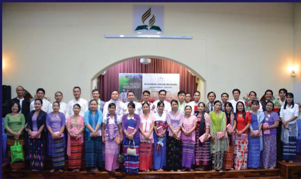
အများဆုံးလက်တင်မင်္ဂလာချီးမြှင့်ခြင်းခံရသောဓမ္မဆရာ ၁၈ဦး။ (ဒီဇင်ဘာ ၁၁၊ ၂၀၁၅)