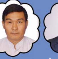
သိက္ခာတော်ရဦးဆားနေညွန့် ကျန်းမာခြင်းဌာန နှင့် နှိပ်စားရေးမှူး