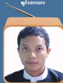
ဆရာဇောကပေါ်မှူး ကြီးကြပ်ရေးမှူး