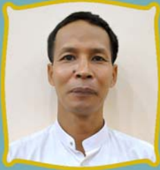
ဆရာဦးနှစ်ခိုင်ထွန်း ငွေစာရင်းကိုင်ချုပ်