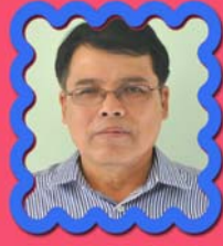
သိက္ခာတော်ရဦးစောကဲ ၉၇၄၄