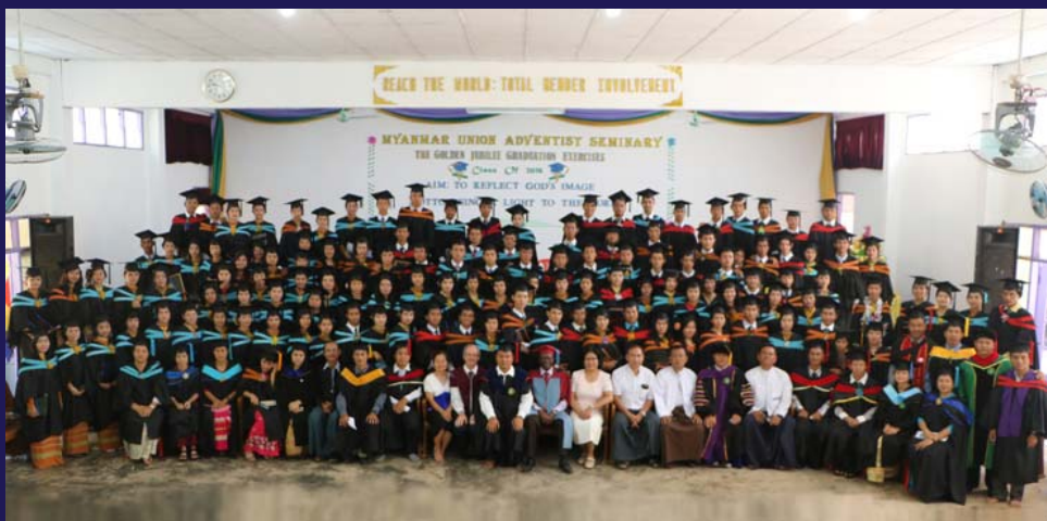
မြောင်းမြဓမ္မတက္ကသိုလ်နှစ်၅၀ပြည့် ရွှေရတနာ့နှင်းသဘင်္ဂ အောင်မြင်ခဲ့သောကျောင်းသူ/သားများ