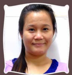
ဆရာမဂရေစီဖိုး ရုံးစာရေး