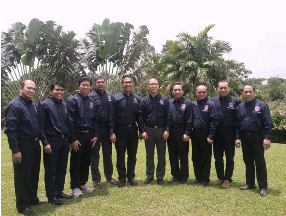
၂၀၁၆ခုနှစ်၊ မေလ ၊ SSD လူငယ်ဌာနမှ ကြီးမှူးကျင်းပသော Adviosry တွင် GC, SSD နှင့် Union မှ ညွှန်ကြားရေးမှူးများ