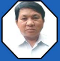
သိက္ခာတော်ရဦးချာချီသောင်း ဌာနဆိုင်ရာညွှန်ကြားရေးမှူး