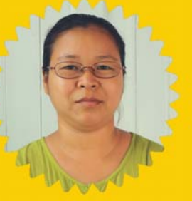
ဆရာမခင်စန္ဒာတင် ငွေကိုင်/ရုံးစာရေး