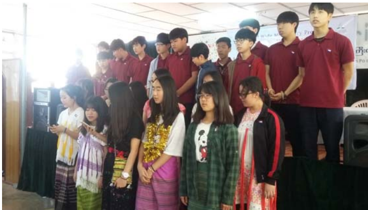
ကိုးရီးယားမှလူငယ်များအဖွဲ့