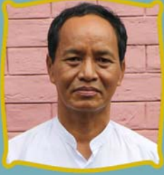
ဆရာဦးဖုန်ခင်ဟောင် ပြင်ဆင်ခွဲခန်းမဌာန