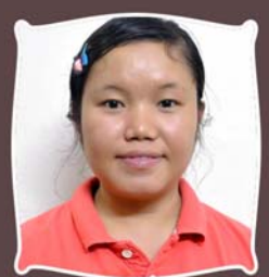
ဆရာမကနဲဖေါ သုခကျန်းမာရေးဌာန