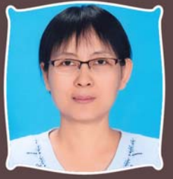
ဆရာမမိုးသူစာ ဓမ္မစာပေးစာယူဌာန