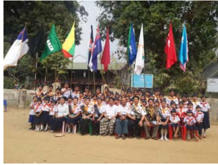
ဧရာဝတီတိုင်း၊ ပိတောက်ကုန်း။