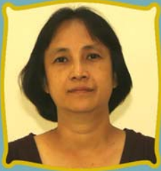
ဆရာမစုစိစိနီ အုပ်ချုပ်ရေးရုံးစာရေး