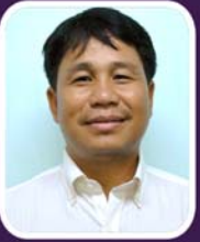
သိက္ခာတော်ရဦးကလေး ဒုက္ခကျောင်းအုပ်