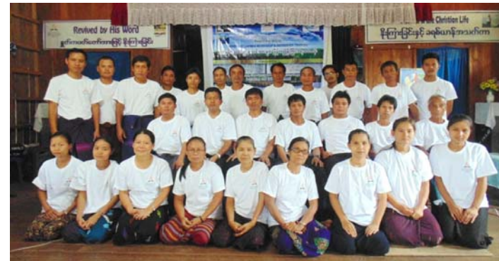
ဓမ္မစာပေဖြန့်ချိရေးသင်တန်း၊ အရှေ့တောင်တိုင်း၊ လေးဖိုးထားရွာ (မေ ၁၁-၁၃၊ ၂၀၁၆)