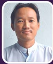
ဆရာဦးသစ် အမျိုးသားအဆောင်မှူး