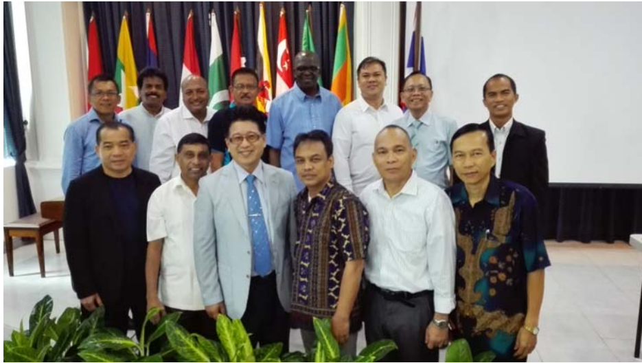
SSD သာသနာ့ဆက်သွယ်ရေးဌာနမှကြီးမှူးကျင်းပသော Adviosry တွင် GC, SSD နှင့် Union မှ ညွှန်ကြားရေးမှူးများ