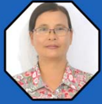
ဆရာမရီအဲနာဝမ်း ဌာနဆိုင်ရာညွှန်ကြားရေးမှူး