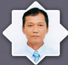
သိက္ခာတော်ရဦးဒေးထူးစိန် SEAS