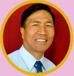
သိက္ခာတော်ရဦးခမ်ဆွင်းမုန် ဌာနဆိုင်ရာညွှန်ကြားရေးမှူး