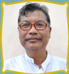
ဦးကျော်လွင် ပို့ဆောင်ရေးဌာန