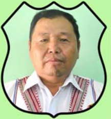
သိက္ခာတော်ရဦးအင်ဒရူးတင် ဌာနဆိုင်ရာညွှန်ကြားရေးမှူး