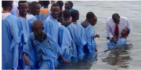
မေ ၂၄ရက်၊ ၂၀၁၆ခုနှစ်သတင်း (Rwanda) ။

စိတ်အားထက်သန်တက်ကြွသည့် အသင်းသူ/သားများအနေဖြင့် နှစ်စဉ်တရားပွဲများ နှစ်ဆတိုးပြုလုပ်ရန် စီမံကိန်းများရေးဆွဲခဲ့ပြီး ဖြစ်သည်။