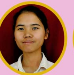
ဒိဗ်ရှင်းလွန်း ကမ္ဘာလုံးဆိုင်ရာရုံးစာရေး