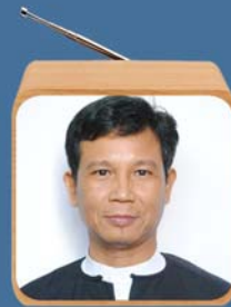
သိက္ခာတော်ရဦးလှမျိုးဝင်း မြန်မာဘာသာ