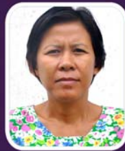
ဆရာမဒေါ်လားရိုး အမျိုးသမီးအဆောင်မှူး