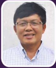
သိက္ခာတော်ရဒေါက်တာပေါလ်တန်ဆောင်နော် ဒုက္ခကျောင်းအုပ်