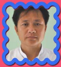
သိက္ခာတော်ရဦးစိန်လွန်း ဌာနဆိုင်ရာညွှန်ကြားရေးမှူး