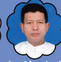
သိက္ခာတော်ရဦးထန်ကနဲလှိုင် ဥပုသ်စာမဂ္ဂဌာန နှင့် နှိပ်စားရေးမှူး