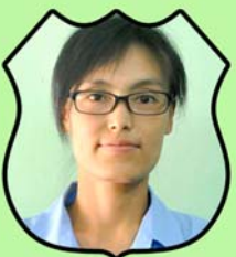
ဆရာမတင်သန္တာထွန်း ရုံးစာရေးမ