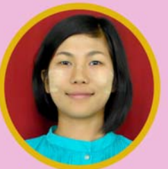
အေးမြဖြူလွန်း ရုံးစာရေး